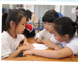
▲ 通過合作學習，一起解決問題