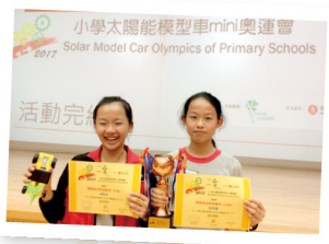
▲ 在小學太陽能模型車 mini 奧運會比賽中獲季軍