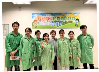
▲ 在經歷體驗活動後，同學們更有信心地確定自己護理業的職志