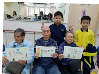
▲ 「愛心服務隊」為長者送上祝福