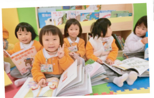
▲ 幼稚園學生全情投入享受繪本閱讀的樂趣