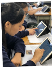
▲ 各科用電子學習軟件加強學習效能