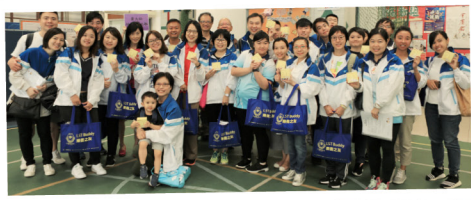
▲ 「樂善之友」企業義工參與探訪活動