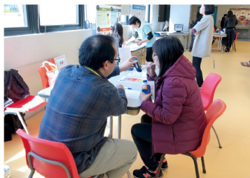
▲ 為企業員工進行一氧化碳呼氣測試