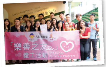
▲ 「樂善之友」義工活動