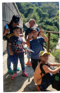
▲ 嘉道理農場內的定向追蹤活動