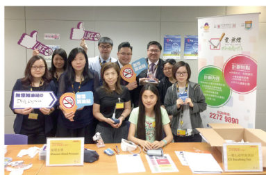
▲ 計劃團隊協助企業推行世界無煙日活動

其中「愛·無煙」前線企業員工戒煙計劃是以協助企業推動無煙文化為目標，以外展形式提供多元化的戒煙服務，包括為員工提供無煙健康講座、一氧化碳呼氣測試、基本健康檢查及為期一年的電話戒煙輔導等。計劃亦會協助企業訂立內部無煙政策，從營運模式、硬件配套、企業形象及內部培訓等多方面為企業設計及籌辦具可持續性的員工健康方案。