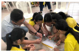
▲ 透過合作遊戲促進親子的溝通，深入了解子女的特質

計劃主要協助基層學生，制訂長遠的個人發展規劃，建立有形（金錢）及無形（社交、人際關係）的資產，促進弱勢社群兒童的長遠發展，改善跨代貧窮問題。計劃內容包括友師訓練、家長工作坊、學生及幼師活動、學校活動、戶外體驗活動參觀及個人發展計劃等。