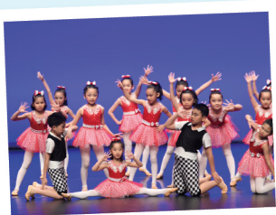
▲ 爵士舞校隊隊員參加「學校舞蹈節」比賽