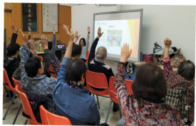
▲ 踴躍地做健腦操，訓練頭腦