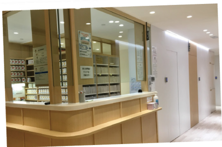
▲ 樂善堂陳廣興紀念基層醫療中心候診區

九龍樂善堂 (簡稱樂善堂)成立於十八世紀中期，當年中國官員前赴九龍城寨視察時，均會於石板碼頭登岸。碼頭附近有一墟集，設有「公秤」。附近市民貨商交易都須先在此處秤量貨物，才進行交易。每次秤量所得款項，則全數用作贈醫、施藥、助殮之用。直至1880年，這個辦理慈善事業的組織，正式成為一個慈善機構，並名為「九龍樂善堂」。