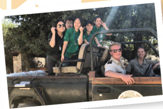
▲ 在南非野生動物保育區與世界各地義工交流

九 龍樂善堂於1880年成立，以「救災紓困、贈醫施藥、興學育才、安老培幼」為宗旨。尤其在「興學育才」範疇上，本堂前人打破古時「女子無才便是德」的守舊觀念，認為男女應平等接受教育。在1929年，先後開辦女子及男子義學，為兒童及青少年提供免費教育和學習的機會；其後更自資籌建及接辦多間政府資助中、小學，造福莘莘學子，打下百年樹人的基礎。