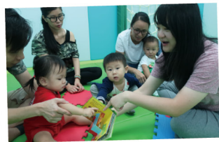
▲ 透過親子工作坊，家長學習訓練幼童的技巧，增強家長育兒的信心