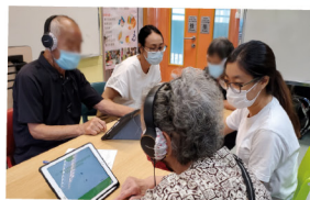
▲ 使用電子程式為年長人士進行認知能力測試