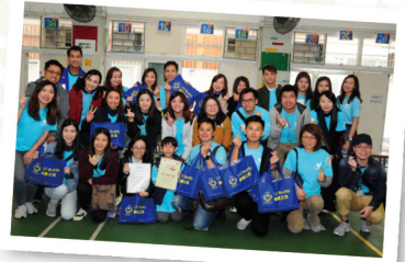
▲ 義工們出發前大合照

樂 善堂於2009年成立「樂善之友」義工團，旨在推動社會大眾參與義務工作活動。「樂善之友」透過服務配對及舉行不同之義工活動，包括社區探訪等，鼓勵來自不同界別的義工為社會弱勢社群送上關懷；並冀望義工回饋社會同時，於個人成長中有所得著，各展所長。「樂善之友」由成立至今，累積參加義工人數已超過6000人次。