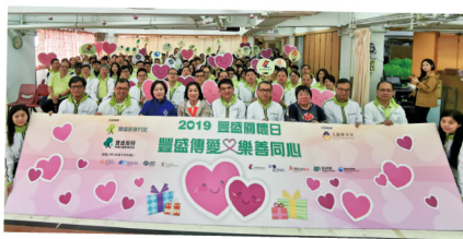
▲ 2019 豐盛關懷日