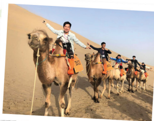
▲ 甘肅考察認識不同文化與地貌，增廣見聞