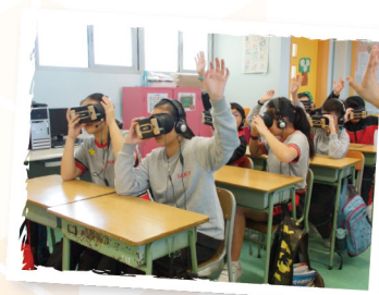
▲學生利用VR到訪垃圾堆填區