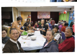
◀ 由義工製作食物，會員享用的冬至聚會