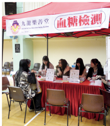
▲ 社區健康檢查 - 血糖檢測

本堂一直致力推展「外展健康教育計劃」，服務旨在提高公眾對身心健康的關注，鼓勵市民身體力行實踐健康生活模式，達至健康人生。本堂每年與眾多團體攜手合作舉辦超過30場活動，合作機構包括地區長者中心、學校、私人企業、工會、非牟利團體等，服務深受大眾歡迎。計劃負責團隊包括醫生、中醫師、護士、社工，以外展形式於社區舉辦健康講座、諮詢服務、健康教育展覽、健康檢查、疫苗接種等活動。服務主題一般會配合團體的需要而制定，務求讓服務使用者獲得適切的健康資訊及專業健康意見。本堂亦會主動將服務推展到不同的社會階層，加強基層醫療所的疾病預防效果。