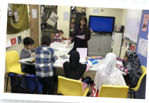
▲ 巴基斯坦學童認真學習中文