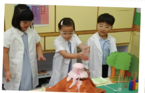
▲ 學生化身小小科學家，動手做科學實驗