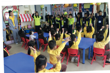
▲ 小四愛心之旅，學生到學校附近的幼稚園當小義工