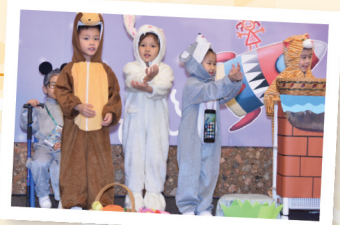
▲ 「童心創造真·善·美」計劃獲「第十四屆藝術教育獎（學校組）」，同學們在分享會向大眾展示計劃成果