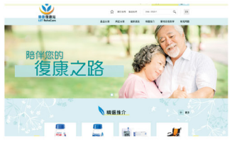
▲ 樂善復康站-網購平台

樂善復康站為有需要人士如長者、復康病人及特殊學習需要兒童提供價格相宜的復康及身體機能訓練用品，以助改善日常生活及身體機能。除門市外，復康站將會於今年增設網購平台，讓顧客隨時隨地、一鍵選購所需用品，更加方便！