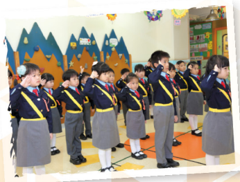
▲交通安全隊精神奕奕又整齊