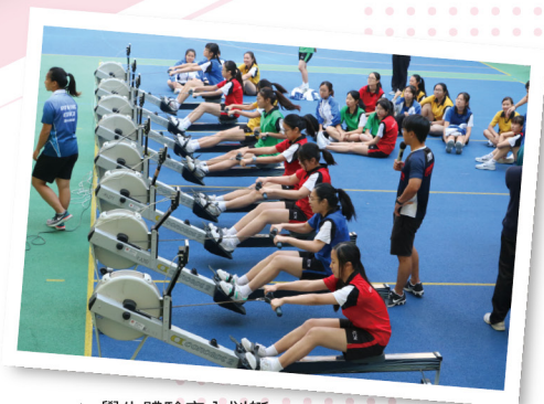
▲ 學生體驗室內划艇